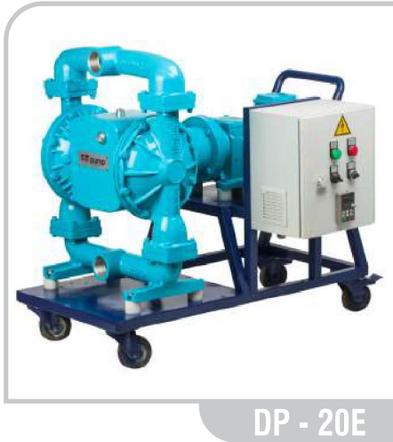
DP - 20E

Elektrikli Diyaframlı Pompalar / DP-20E Electromechanical Diaphragm Pumps / DP-20E