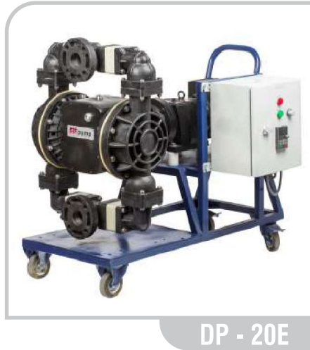
DP - 20E