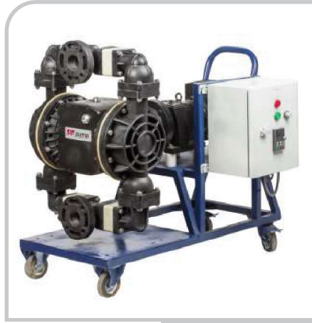
DP - 30E